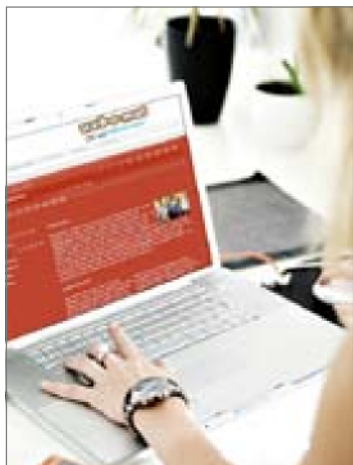
Homepage erstellen Der web-o-mat hilft.

P rogrammieren – das klingt schon langweilig. Wer seine eigene Homepage ins Internet bringen will, braucht sich ab sofort nicht mehr mit dem Programmieren zu plagen.